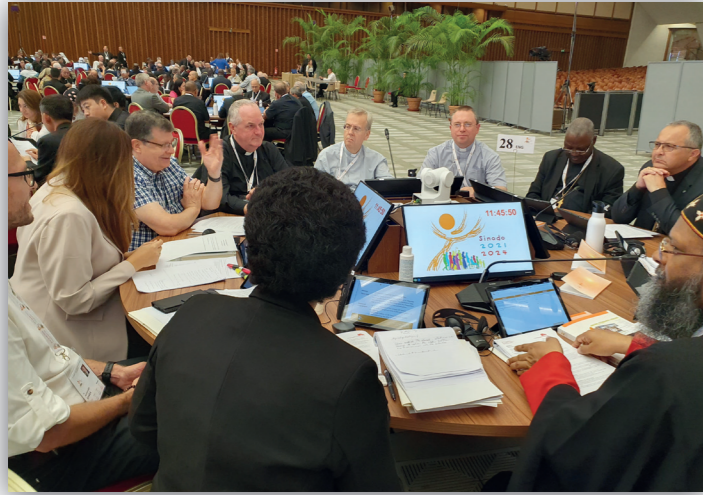
Mgr. Hoogenboom tijdens één van de sessies van de eerste zitting van de Bisschoppensynode in oktober 2023

van het synthesedocument dat na de eerste zitting van de 16 de Gewone Algemene Vergadering van de Bisschoppensynode aan paus Franciscus is aangeboden.