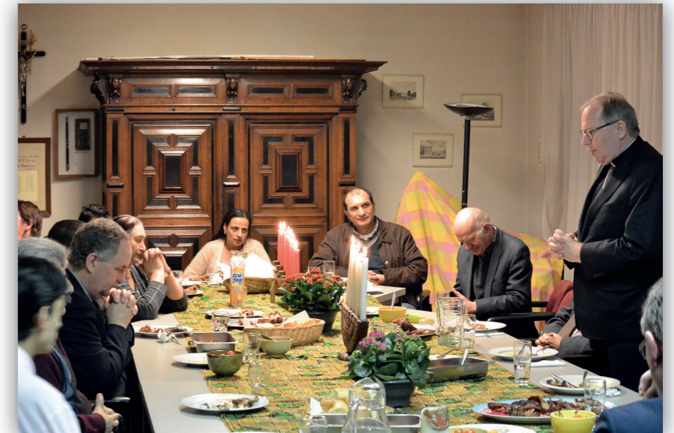
Ontmoeting en maaltijd met enkele Roma families (Nieuwegein, 2017) b.g.v. het diaconaal werkbezoek aan projecten in de parochie H. Drie-eenheid

belangen en motieven te verdiepen. Ik identificeer me teveel met de rol van helper en kan moeilijk van mens tot mens, dus naast actief ook contemplatief, communiceren.'