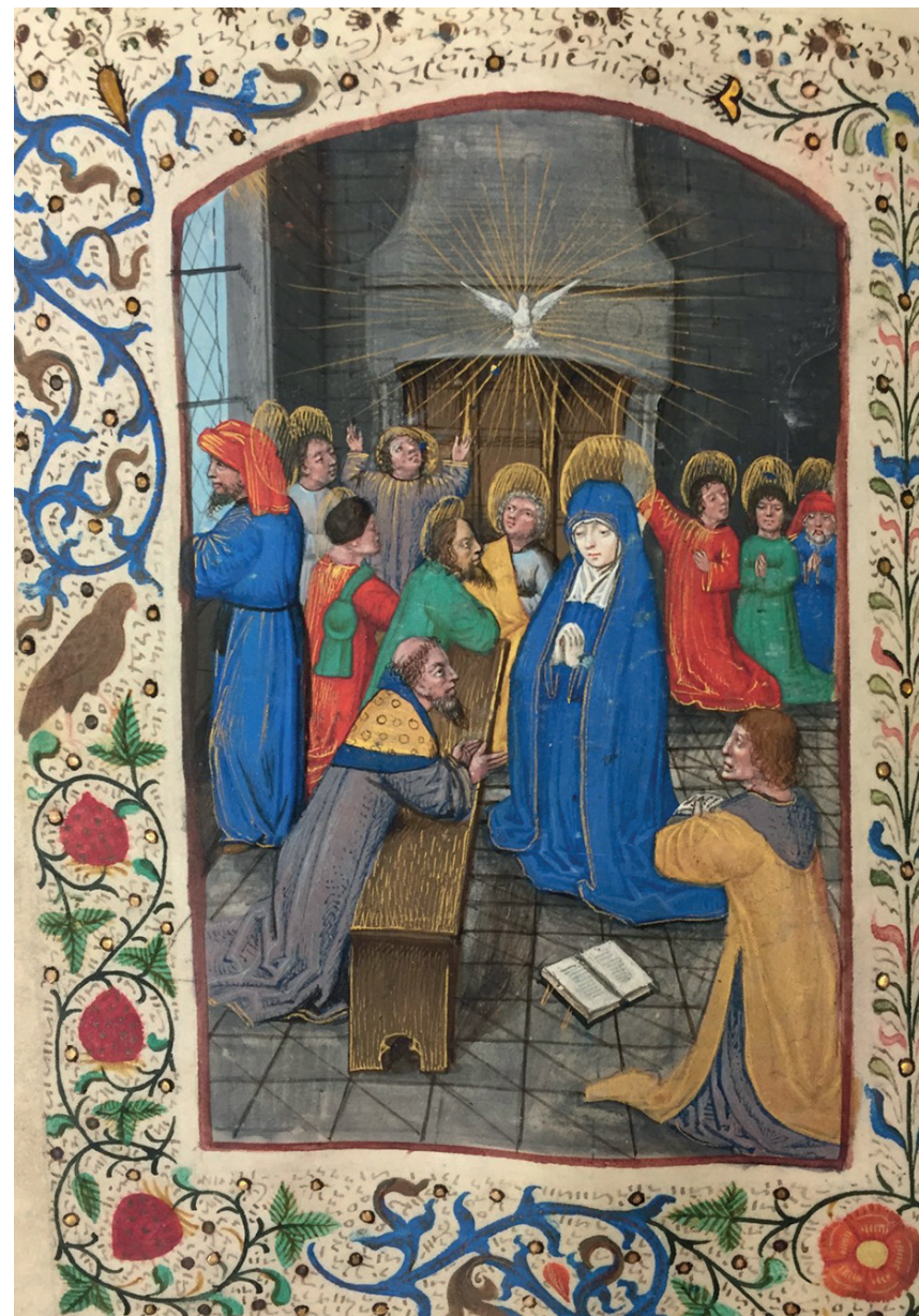
Maria en de apostelen ontvangen met Pinksteren de H. Geest

Uit: Annunciatie Getijdenboek (1490-1495) Geert Grote (auteur) en Meester van de Wodhull-Harberton Getijden (illustrator) Collectie: Aartsbisshoppelijk Museum (ABM) – Museum Catharijneconvent, Utrecht